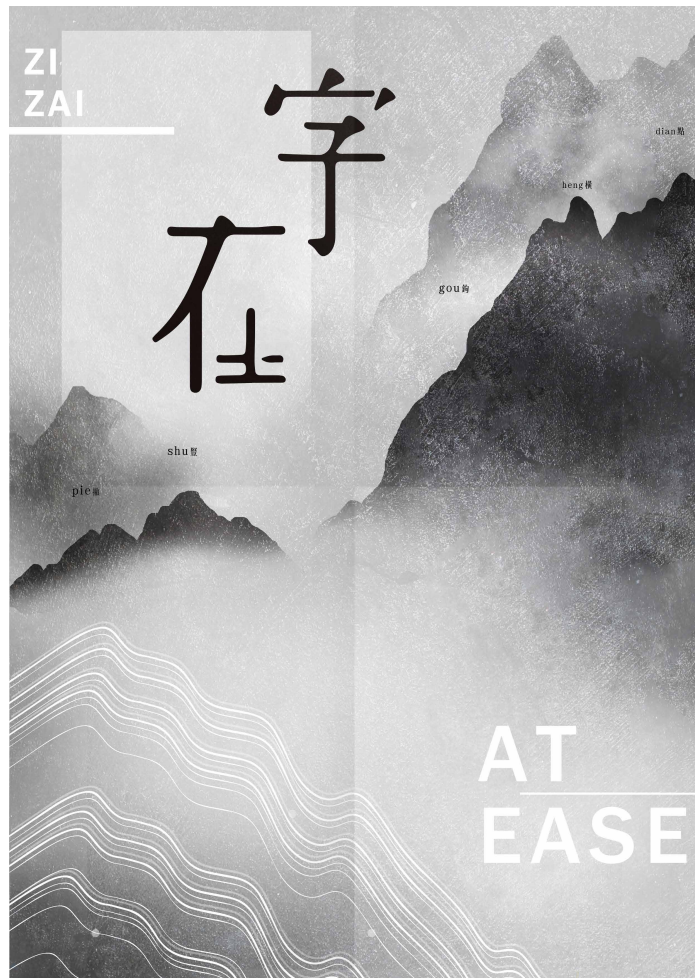
主視覺設計 | VI design