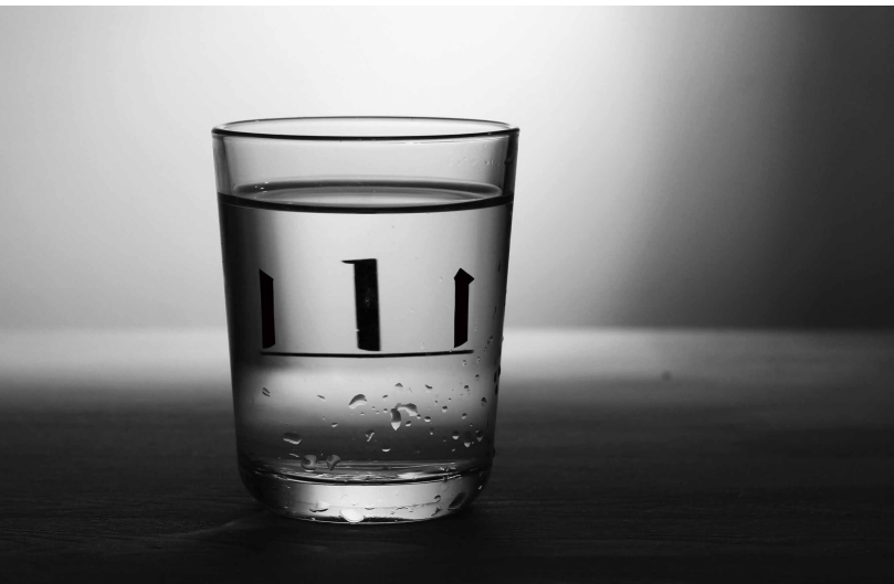
山 | MOUNTAIN